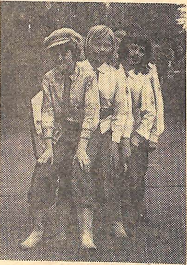
Ребята 5-го отряда инсценируют песню «Семеро зятьев».