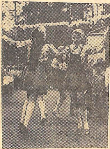
Весело, задорно исполняют девочки танец «Казачок».

А эти снимки показывают только два момента праздника «Русская ярмарка».